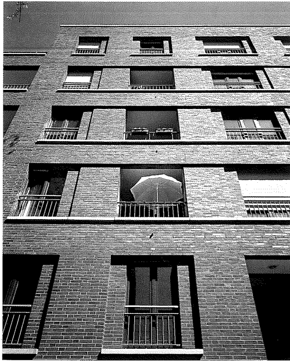
[2] Fassade des Wohnblocks